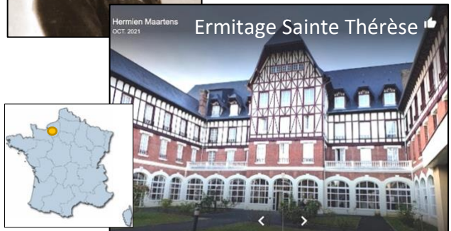
Hermien Maartens OCT 2021