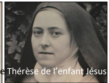
Sainte Thérèse de l'enfant Jésus