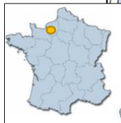
Ermitage Sainte Thérèse