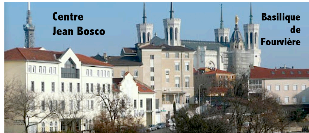
Centre Jean Bosco