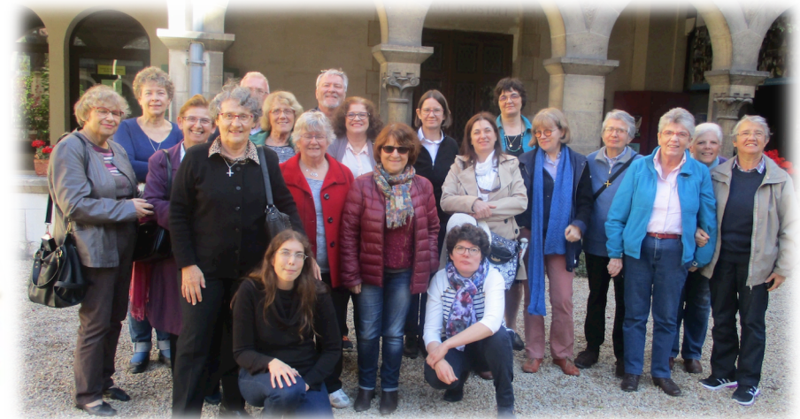
Basilique de Fourvière

1998 : Quelques Sourds décident de se retrouver pour échanger et permettre à tous de découvrir, en langue des signes, ce qui fait sa Foi, pour se former et devenir formateur.